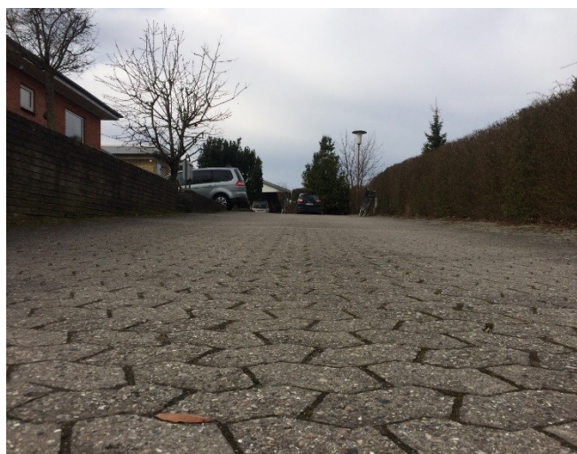
50 år gamle SF sten der ligger flot. Trods flere opgravninger efter gas- og vandrør i årenes løb.